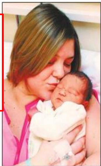
Pesar más de 3,5 kilos augura mejores aprendizajes.

Así lo muestra el estudio "Asociación de variables perinatales y socioeconómicas con los resultados del Simce 2006", realizado por académicos de las facultades de Medicina y Educación de la U. Católica, y que fue presentado en el XVI Congreso Chileno de Pediatría.